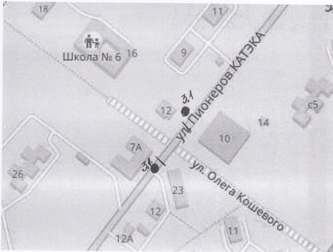
Схема размещения дорожно-знаковой информации в п. Дубинино 10 марта 2019 г. с 12-45 до 16-00 час.

Приложение № 2 к распоряжению Администрации города Шарыпово № 148 от 15 .02.2019г.